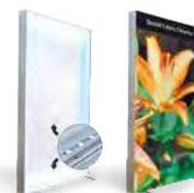
Druk na folii Backlit