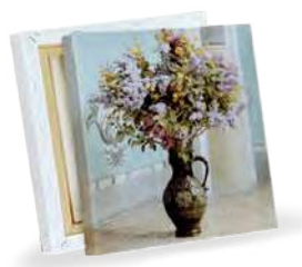
Obraz naciągnięty na ramę