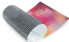
Druk na folii One way vision