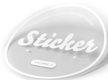
Naklejki na folii montażowej