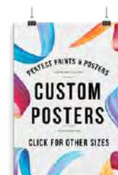
Produkcja plakatów, druk na papierze plakatowym