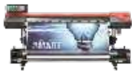
Druk na folii samoprzylepnej