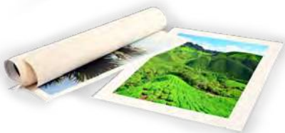
Druk na płótnie