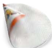
Druk na folii Easy dot