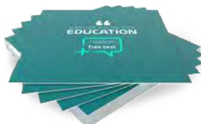
Produkcja szyldów i tablic PCV