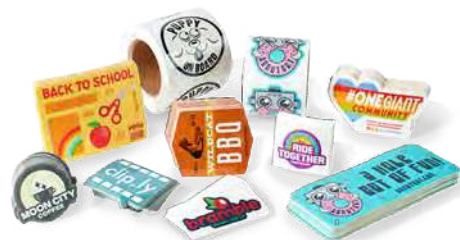
Naklejki i etykiety